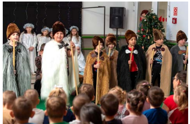
FOTÓK: GYERMEKSZIGET ÓVODA - BÖLCSŐDE

2024. december 19-én a Mazsola csoport óvodásai egy varázslatos betlehemi műsorral lepték meg óvodánk közösségét és a szülőket. Az előadás színes és meghitt hangulatban zajlott, és mindenki, a kicsik és a nagyok egyaránt, elragadtatással figyelték a gyermekek előadását.